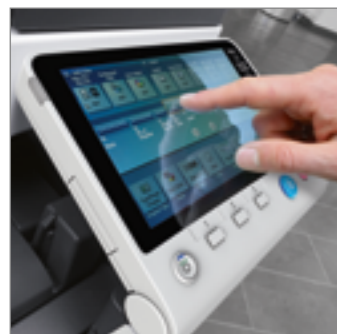
Pantalla multitáctil color de 7" con teclado físico (opcional)

MATERIALES RECICLABLES PARA REDUCIR EL IMPACTO AMBIENTAL