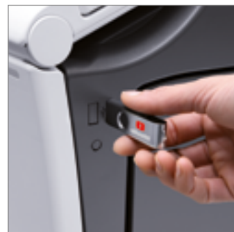
Impresión y escaneado directo desde la memoria USB. Impresión directa de documentos formatos Microsoft Office (OOXML)