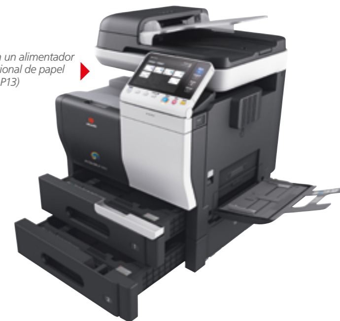
Con un alimentador opcional de papel (PF-P13)

Es posible aumentar la capacidad estándar de 650 hojas de papel hasta un máximo de 1.650 añadiendo hasta dos unidades de papel de 500 hojas e incrementando todavía más la productividad de la oficina instalando un grapador opcional.