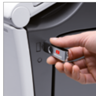
Impresión y escaneo directo desde la memoria USB. Impresión directa de documentos formatos Microsoft Office (OOXML)