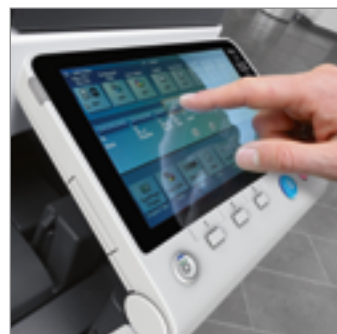
Pantalla multitáctil color de 7" con teclado físico (opcional)

MATERIALES RECICLABLES PARA REDUCIR EL IMPACTO AMBIENTAL